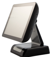
elegantes und bis ins Detail durchdachtes Design.

Die Titan-Serie ist ausgestattet mit einem Intel i3 Prozessoren neuester Generation, leistungsstark und energieeffizient. Die Schnittstellenausstattung lässt keine Wünsche offen. Der Speicherplatz ist bis max. 16 GB erweiterbar.