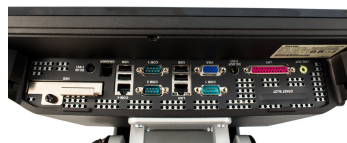
Die umfangreiche Schnittstellenausstattung der Titan-Serie erfüllt auch höchste Anforderungen

Ein benutzerfreundliches Kabelmanagement für einen durchorganisierten Kassenplatz